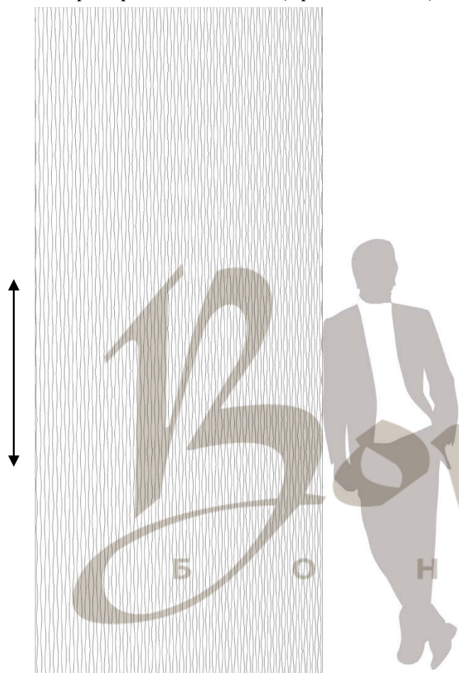
Полноразмерный вид 2795x1200 (Фронтальный вид)