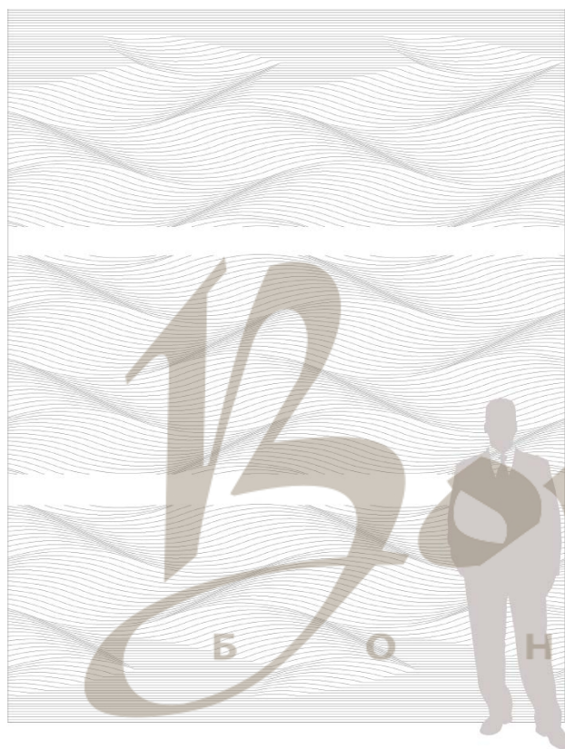
Фронтальный вид (Три панели размером 2795x1200)