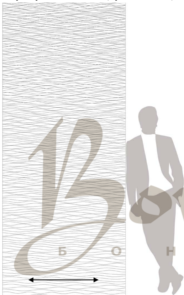
Полноразмерный вид 1200x2795 (Фронтальный вид)