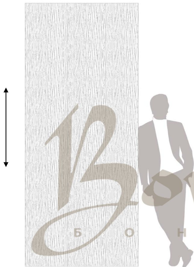
Полноразмерный вид 2795x1200 (Фронтальный вид)